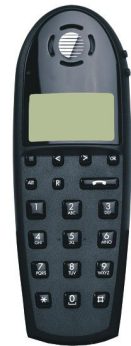
Johdoton Forte Dect-puhelin

Toiminnepuhelimen lisäksi vaihteseen voidaan liittää myös aivan tavallisia, analogisia päätelaitteita sekä johdottomia puhelimia. Integroiduissa Forte Dect -puhelimissa nähdään myös soittajan numero.