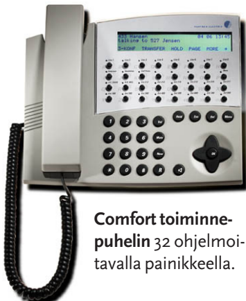
Comfort toiminnepuhelin 32 ohjelmoitavalla painikkeella.

Forte-puhelinjärjestelmään voidaan perustaa useita automaattisia puheluohjausryhmiä, eli ACD-ryhmiä, esim. uudet autot, käytetyt autot, huolto... jne. Sama henkilö voi kirjautua yhteen tai useampaan palveluryhmään. Toiminnepuhelimen näytöltä näkyy ryhmän jonotilanne. Ryhmät voidaan ylivuotaa muihin ryhmiin.