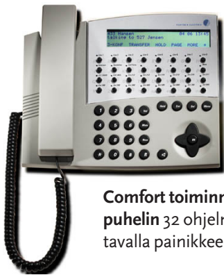
Comfort toiminnepuhelin 32 ohjelmoitavalla painikkeella.

Helppokäyttöisten toiminnepuhelimien lisäksi vaihteeseen voidaan liittää myös aivan tavallisia analogisia puhelimia. Jos puhelimissa on näyttö, nähdään soittajan numero. Järjestelmään voidaan liittää myös johdottomia Dect-puhelimia Toiminnepuhelimissa on kuulolaitesilmukka.